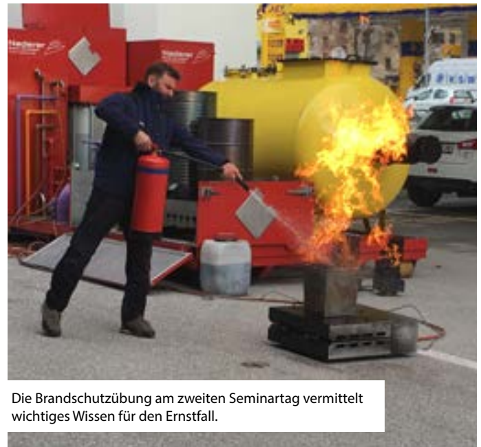
Die Brandschutzübung am zweiten Seminartag vermittelt wichtiges Wissen für den Ernstfall.